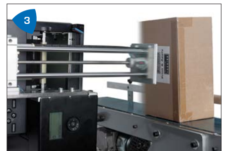
3 Versatile, applica etichette dal basso, dall'alto o dai lati con qualsiasi rotazione.