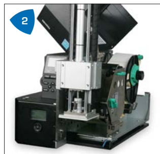
2 Compatto, sicuro e facile da gestire da parte dell'operatore.